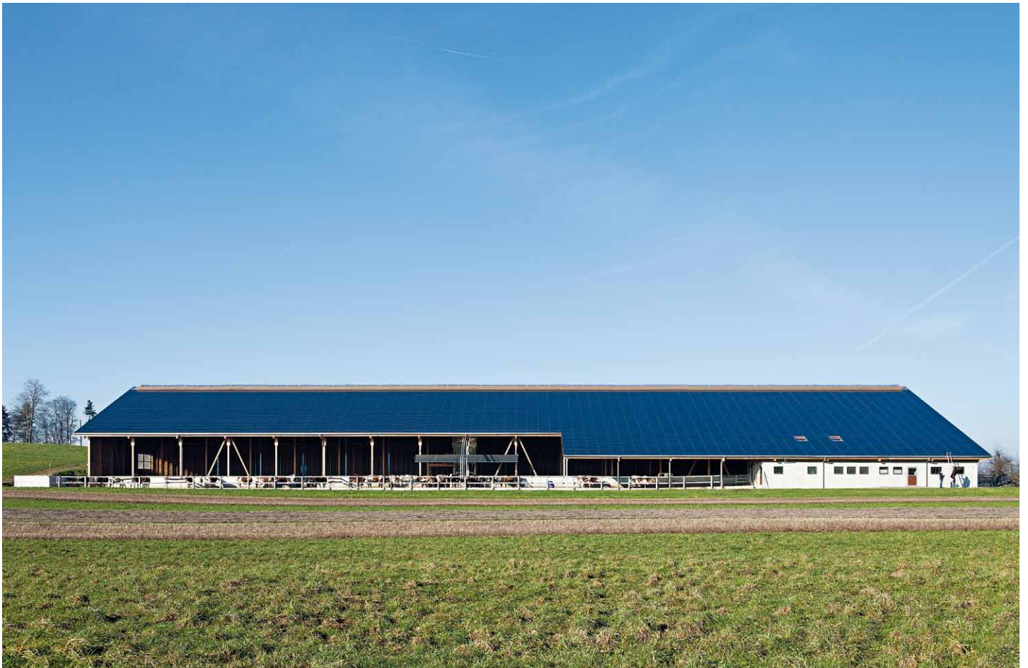
Fotovoltaikanlage Melchnau bei Langenthal